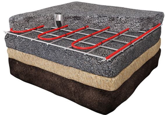
Montare în asfalt derulat