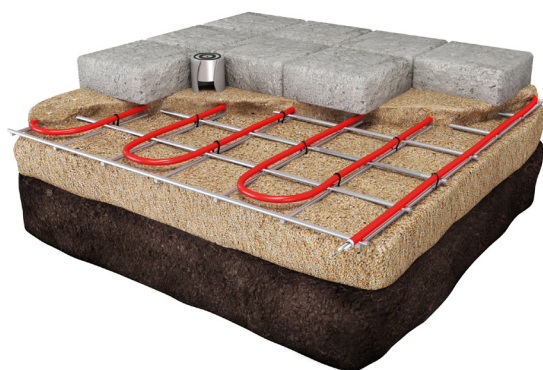
Montare în pat de nisip sub pavaj